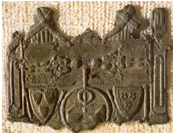
Plomb de Lirey (Musée de Cluny)

Témoin du pèlerinage dont ce linceul a été l'objet à Lirey, le Musée de Cluny conserve une enseigne de pèlerinage de la seconde moitié du XIV ème siècle ou de la première moitié du siècle suivant, présentant, outre la plus ancienne représentation connue de ce linceul, les blasons des familles de Charny et de Vergy (voir photo ci-dessous).